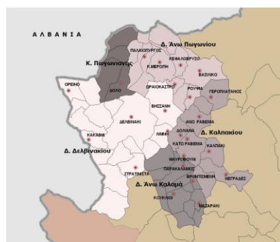
Σχήμα 2. Οι οικισμοί όπου πραγματοποιήθηκε η έρευνα στο Ν. Ιωαννίνων