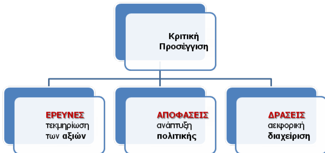
Εικόνα 1. Στάδια Κριτικής Προσέγγισης Τοπίου

Σύμφωνα με τα στάδια αυτά, τα οποία μπορούν να αξιοποιηθούν άμεσα από τον χώρο της προστασίας της βιομηχανικής κληρονομιάς, προηγούνται οι έρευνες για την τεκμηρίωση των αξιών της υπό έρευνα βιομηχανικής κληρονομιάς συμπεριλαμβανομένου του ευρύτερου βιομηχανικού τοπίου, για κάθε μια από τις προαναφερθείσες τρεις χαρακτηριστικές περιόδους στην εξέλιξη του τοπίου, ακολουθούν οι αποφάσεις για την ανάπτυξη σαφούς πολιτικής και τέλος αναλαμβάνονται δράσεις με στόχο την αειφορική (ή μη) διαχείριση του πολιτιστικού αυτού αποθέματος.