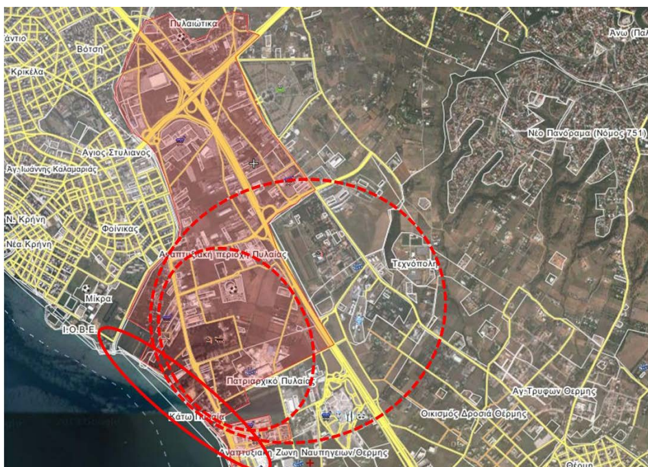
Εικόνα 4. Υποβαθμισμένη Ζώνη Τοπίου: Ναυπηγεία Θεσσαλονίκης

Μια άλλη ζώνη τοπίου που δεν έχει, έως σήμερα, προσεγγισθεί σφαιρικά είναι η ζώνη μεταξύ των εργατικών κατοικιών της Ν. Κρήνης και του αεροδρομίου Μίκρας (Εικ. 4, σημειώνεται με συνεχή κόκκινη έλλειψη). Η ζώνη διέλαθε της προσοχής ολοκληρωμένων περιφερειακών ή γενικών πολεοδομικών σχεδιασμών. Ωστόσο, σταδιακά και αποσπασματικά, στην περιοχή έχουν αναπτυχθεί μεγάλα εμπορικά καταστήματα και κέντρα, θεματικό πάρκο που φιλοξενεί εγκαταστάσεις με ψυχαγωγικές δραστηριότητες (Εικ. 4, μικρός κόκκινος κύκλος), αλλά και το Κέντρο Διάδοσης Επιστημών και Μουσείο Τεχνολογίας ΝΟΗΣΙΣ (Εικ. 4, μεγάλος κόκκινος κύκλος). Η ευρύτερη περιοχή συγκεντρώνει σήμερα μεγάλο αριθμό επισκεπτών και νεολαίας, χωρίς σχεδιασμό ασφαλούς μετακίνησης, ποδηλατοδρόμων κ.ά. και κυρίως χωρίς τη δυνατότητα άμεσης πρόσβασης στη θάλασσα (Εικ. 5). Η γράφουσα δεν έχει μελετήσει την περιοχή, απλώς εντοπίζει το πρόβλημα της ζώνης και παροτρύνει για την ορθολογική αντιμετώπισή της ως σύνολο.