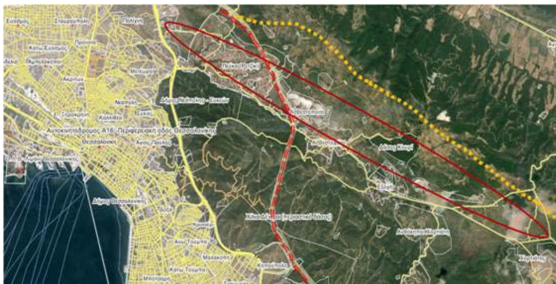
Εικόνα 3. Ζώνη πολιτιστικού τοπίου Χορτιάτη-Ασβεστοχωρίου. Εξωτερική περιφερειακή οδός: αρχική χάραξη με κόκκινη διακεκομμένη γραμμή- μεταγενέστερη χάραξη με κίτρινες στιγμές.